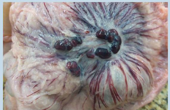
Abb.1: blutige ebenholzfarbige Lymphknoten